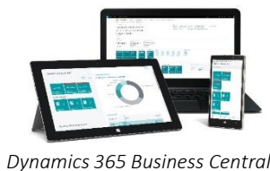
Dynamics 365 Business Central