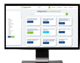
Online træning (Vidensportalen)